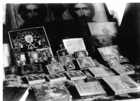
ИКОНЫ, ПРИНАДЛЕЖАВШИЕ ЦАРСТВЕННЫМ МУЧЕНИКАМ, ОБНАРУЖЕННЫЕ ПОСЛЕ ИХ УБИЙСТВА В ИПАТЬЕВСКОМ ДОМЕ