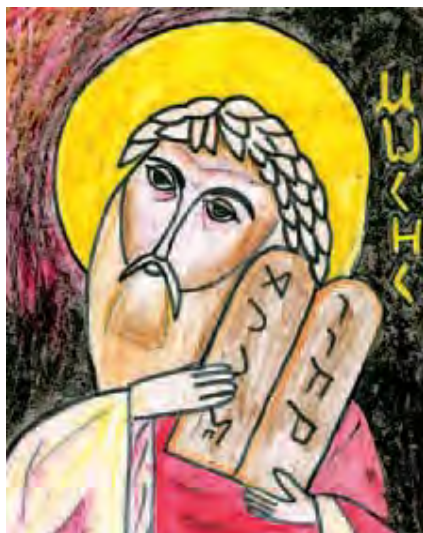
Святой пророк Моисей

Сам свалил песок на вал Высоченный самосвал.