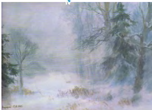
СЕРГЕЙ АНДРИЯКА. ПУРГА В ЛЕСУ