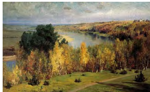
Василий Поленов. Золотая осень